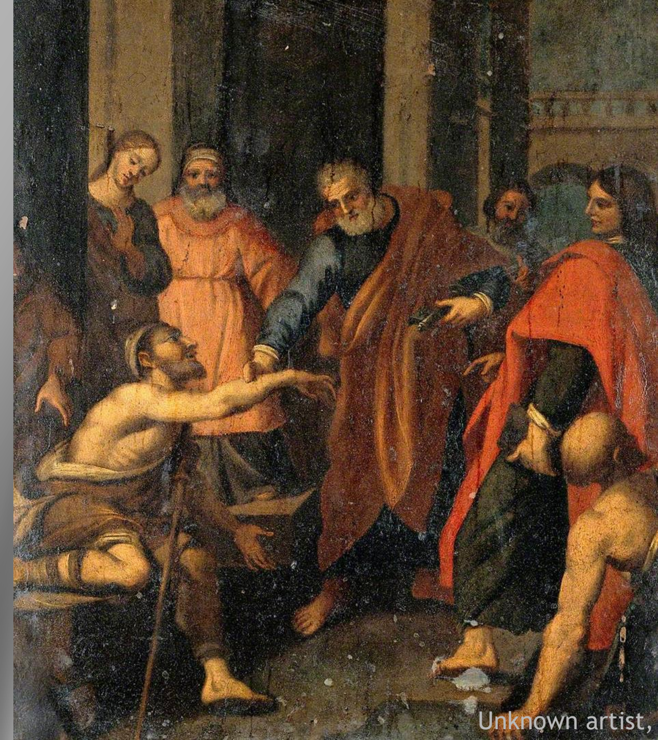
Unknown artist, 1600-1800s